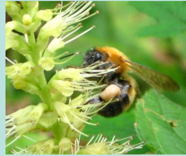
②テンニンソウで蜜を集めるハナバチの仲間