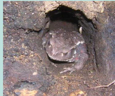
③木の根元にアズマヒキガエルがじっとしていました。湿った土の上で暑さを避けていたのかもしれない。