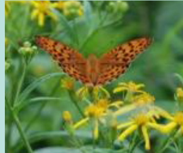
①キオンにやってきたヒョウモンチョウの仲間

ぜひ、みなさんも、生きものがいそうな場所を想像して、たくさんのお出合いを体験してください！（鈴木）