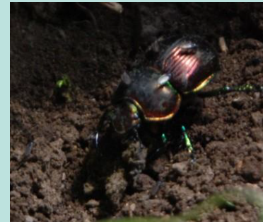
④フンを運ぶオオセンチコガネ